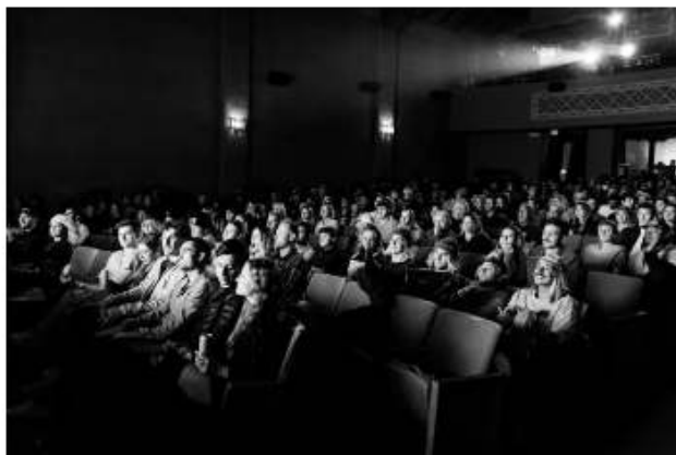
| Fotografía: Daniel Guerra | Unsplash